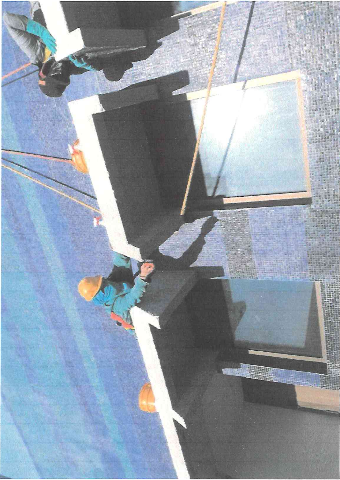
Limpieza en las pestañas o parteluces de los vanos en el sector A5.