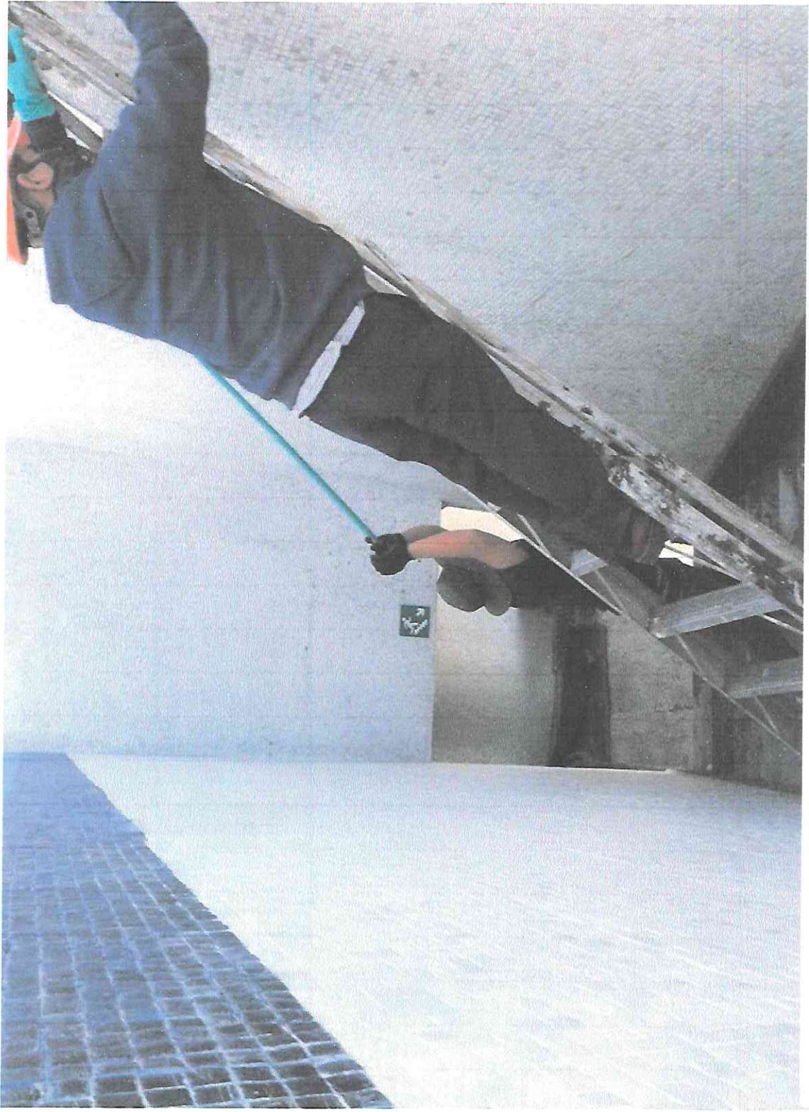
Limpeza de tesela con cepillo entre las gradas y la fachada del sector A5.